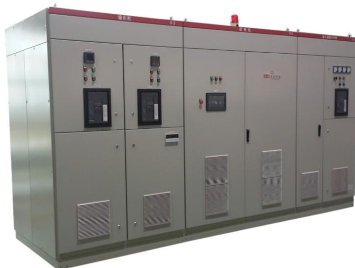
SVF 系列大功率室内式船用变频岸电电源设备